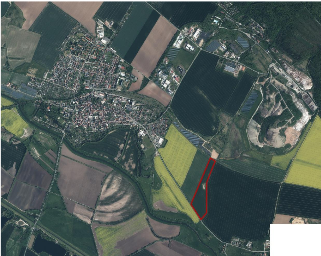
Lage des Geltungsbereiches im Osten der Gemarkung Roßleben

Das Plangebiet befindet sich südöstlich des Stadtgebietes Roßleben, direkt an der Grenze zur östlich angrenzenden Gemeinde Kaiserpfalz im Bundesland Sachsen – Anhalt. Die Flächen besitzen eine Ausdehnung von ca. 12,4 ha und werden aktuell als Ackerflächen genutzt.